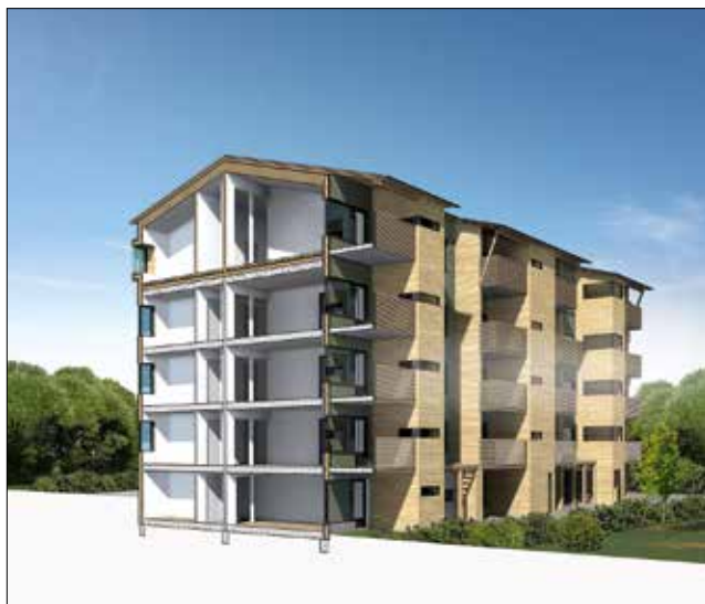
Kuva 55. Tyypillinen lähiötalo ennen ja jälkeen korjauksen. Suunnitelmat: ISS-Suunnittelupalvelut, Eija-Riitta Miettinen Visualisoinnit: Modelark Titta Vuori